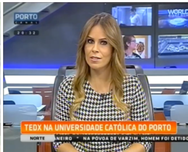
Porto Canal - Jornal Diário

Audiência: 6776 Duração: 06:26 Entrevista em directo com 3 Repetições