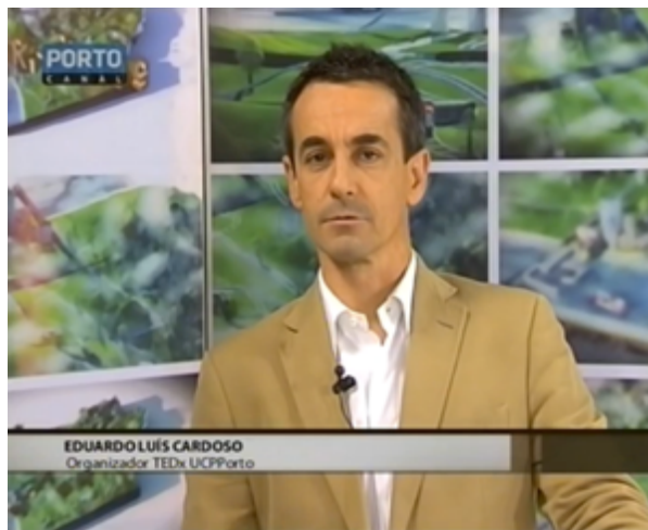
Porto Canal - Territórios

Audiência: 6776 Duração: 06:26 Entrevista em directo com 3 Repetições