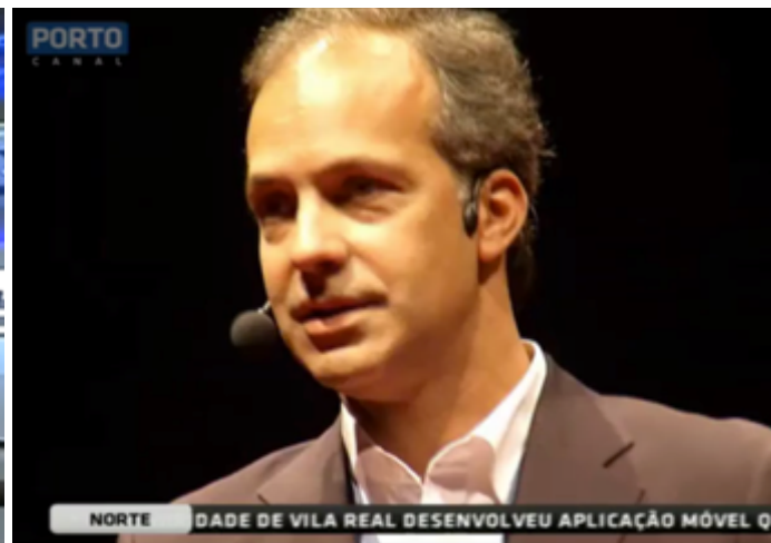
Porto Canal - Jornal das 13

Audiência: 9680 Duração: 02:21 Reportagem com entrevista a oradores