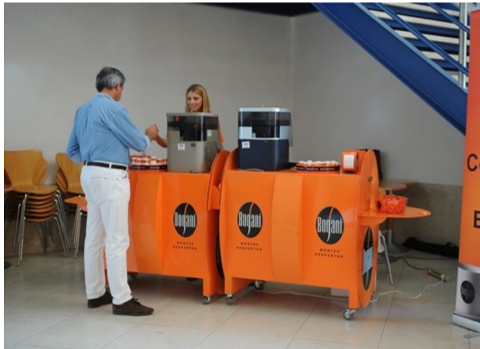
Ação de degustação de café