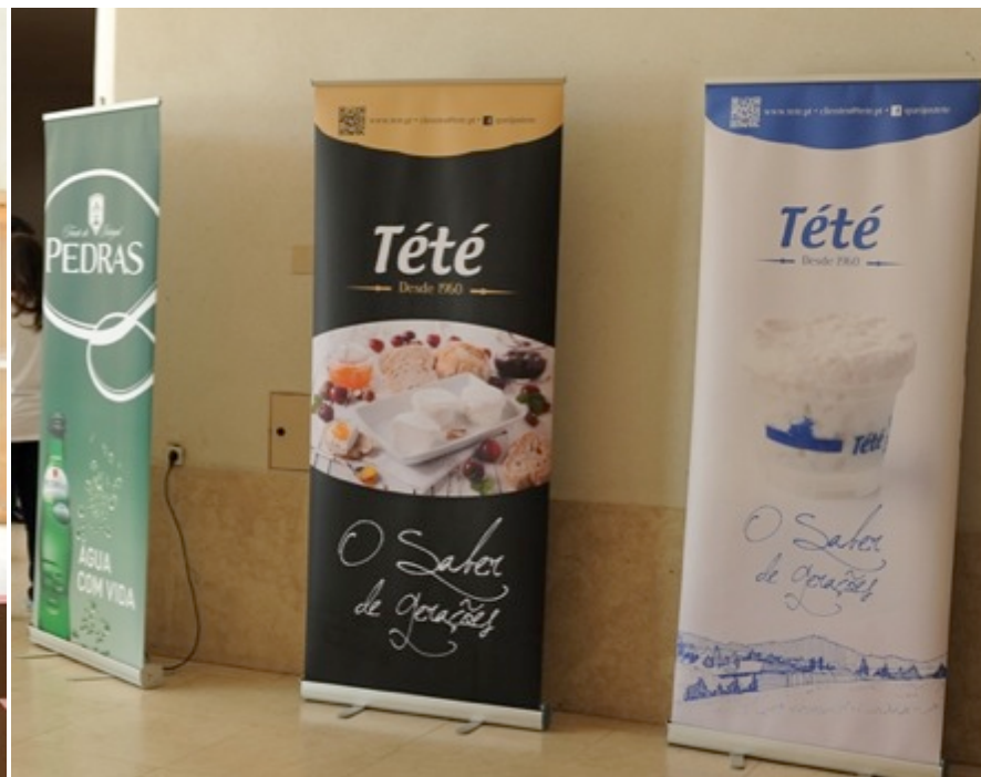
Unicer | Mojobrands | Anceve | Tété